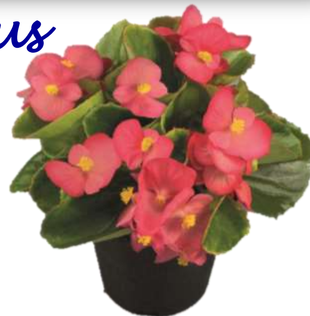
Begonia Sprint Plus Lipstick 60-1342