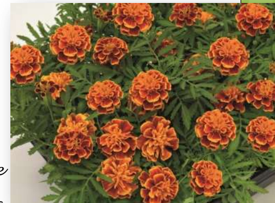
Orange Flame 61-4246