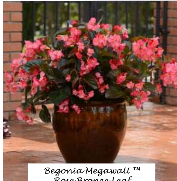
Begonia Megawatt™ Rose Bronze Leaf 60-1203