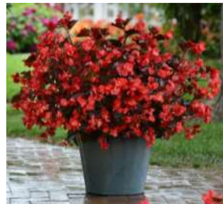
Begonia Megawatt™ Red Bronze Leaf 60-1206