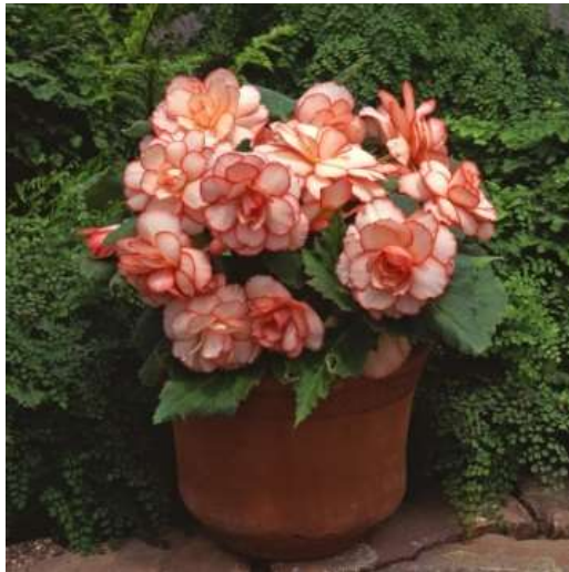
Picotee Calypso 60-1422