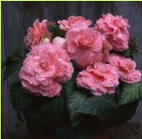
Picotee Lace Pink 60-1425