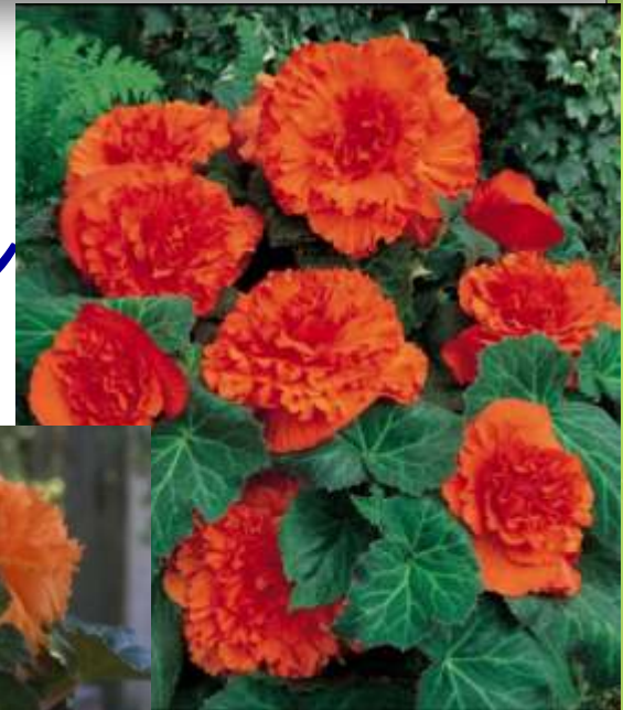
Orange Mandarin 60-1447