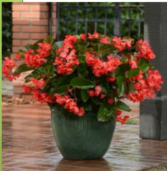
Begonia Megawatt™ Red Green Leaf 60-1205