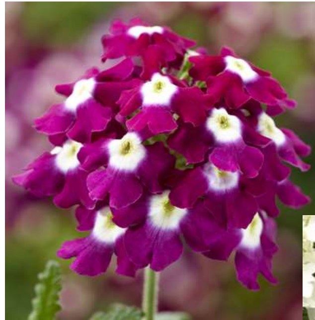
Burgundy with eye 61-8902