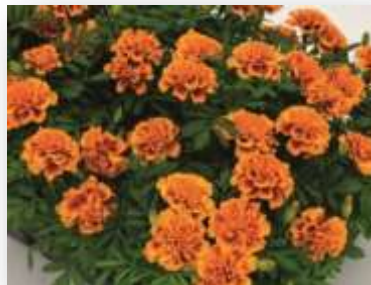
Orange Bee 61-4241