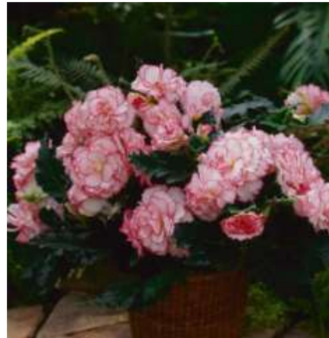
Picotee White Pink 60-1428