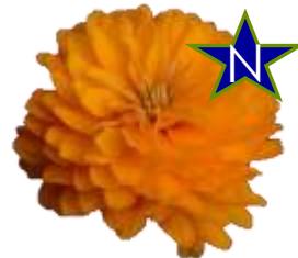
Bright Orange 61-9831