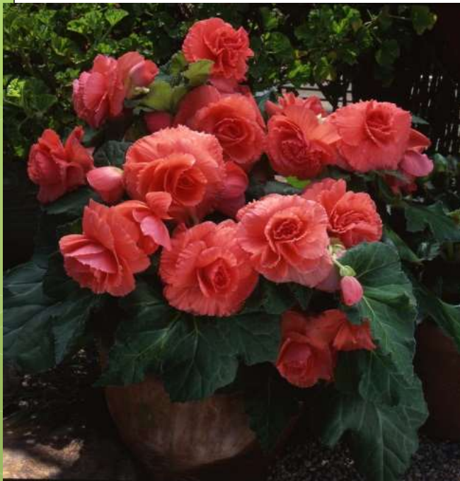
Coral Salmon 60-1444