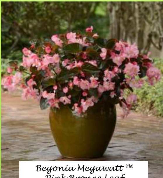
Begonia Megawatt™ Pink Bronze Leaf 60-1202