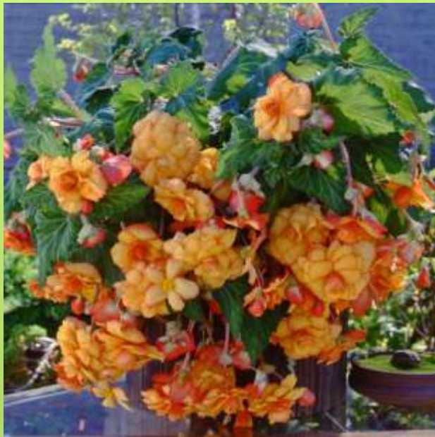
Yellow Red Picotee 60-1457