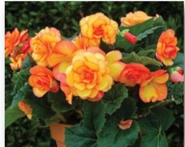
Sun Glow 60-1403