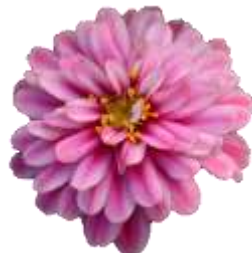
Raspberry Ripples 61-9829