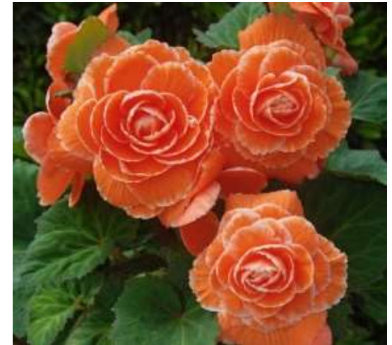
Picotee Lace Apricot 60-1428