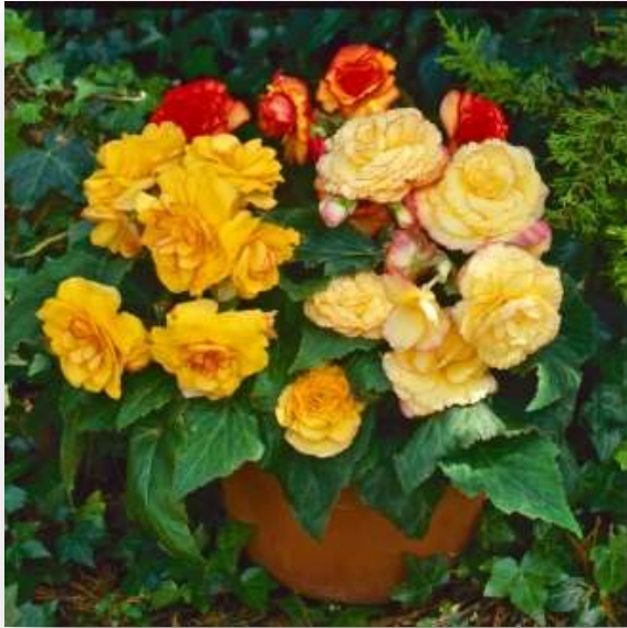
Sunset Shade 60-1402