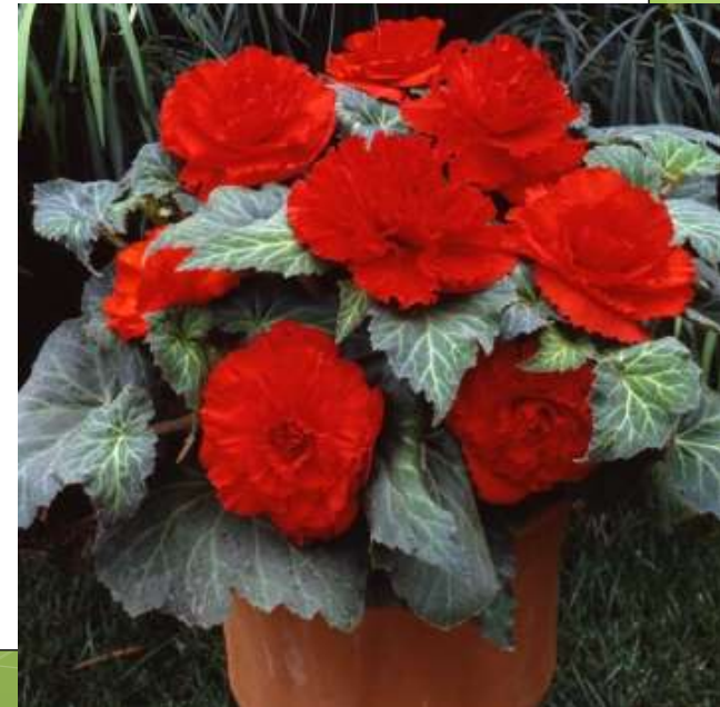
Scarlet Red 60-1446