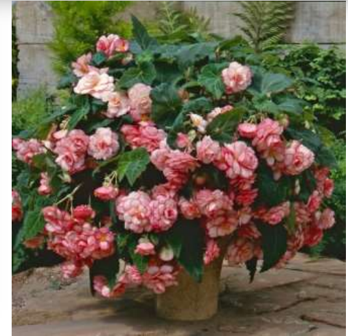
White Pink Picotee 60-1455