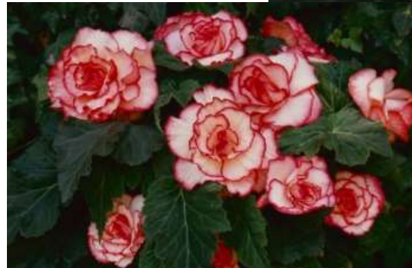
Picotee Sunburst 60-1423