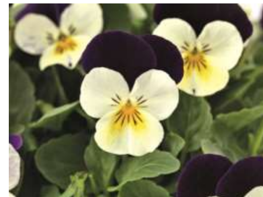
White Purple Wing 61-9378