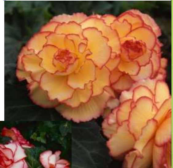
Picotee White Red 60-1427