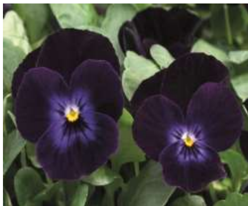
Deep Purple Face 61-9367

Trois (3) nouvelles couleurs dans la série.