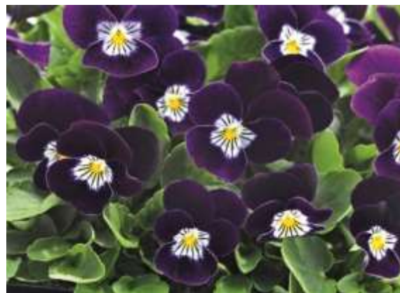
Purple White Face 61-9377