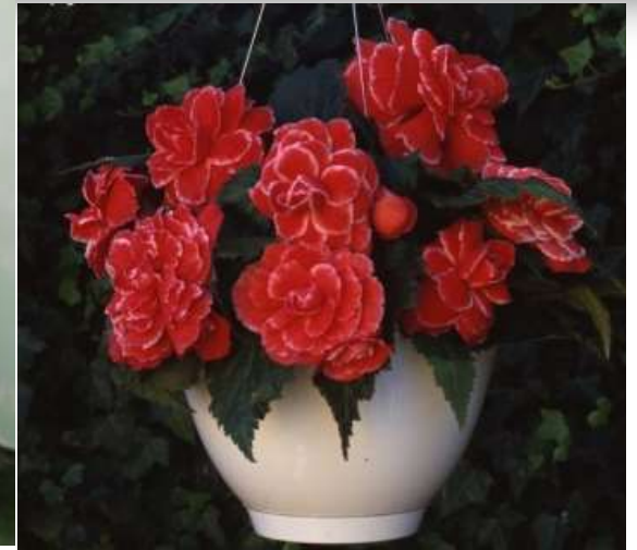
Picotee Lace Red 60-1426