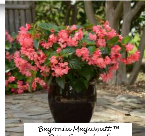
Begonia Megawatt™ Rose Green Leaf 60-1204