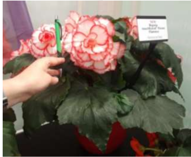
Picotee Flamenco 60-1421