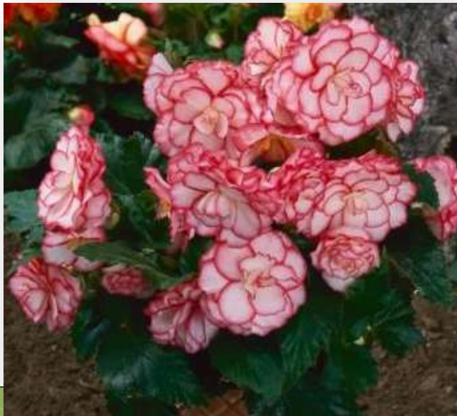
Pink Halo 60-1401