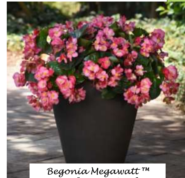
Begonia Megawatt™ Pink Green Leaf 60-1207