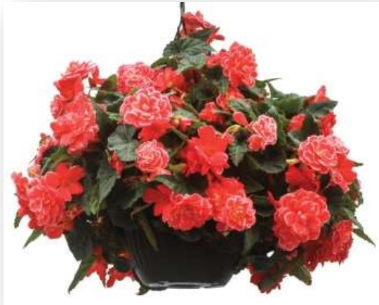
Melon Lace 60-1405