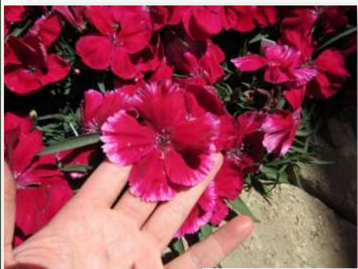
61-3736 Cherry Red