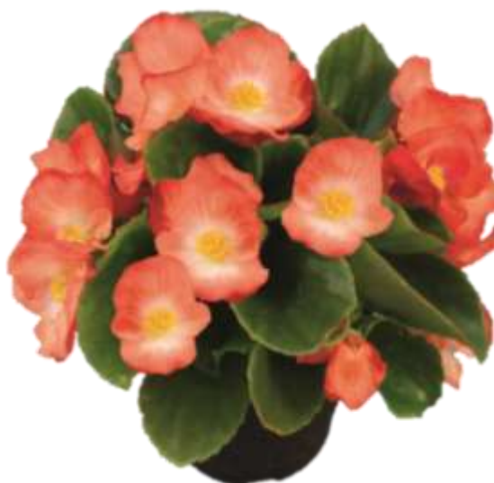
Begonia Sprint Plus Orange Bicolor 60-1343