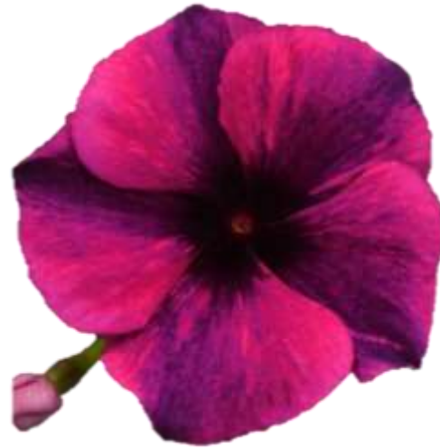
61-9111 Black Cherry